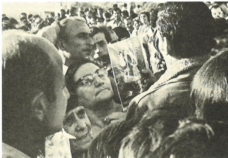
"ΜΗΠΩΣ ΕΙΔΕΣ ΤΟ ΓΙΟ ΜΟΥ;"

ρώτησα αν είδαν να συλλαμβάνονται αιχμάλωτοι. Μου απάντησαν αρνητικά. Τους παρακάλεσα να ρωτήσουν και τους Τούρκους που βρίσκονταν πολύ πλησίον απέναντι. Οι Τούρκοι τους είπαν ότι δεν είχαν συλληφθεί αιχμάλωτοι κατά τη διάρκεια των μαχών και ότι υπήρχαν όμως νεκροί. Μετά από μερικές μέρες πήγα ξανά στο τάγμα του συζύγου μου, ρώτησα στρατιώτες και έμαθα ότι υπήρχαν νεκρούς τους οποίους συνέλεξαν άνδρες της ΣΜΕΦ. Πήγα στη ΣΜΕΦ και βρήκα τους στρατιώτες που μάζεψαν τους νεκρούς. Ρώτησα αν είχαν θάψει κάποιον που φορούσε τζιν παντελόνι και στρατιωτικό πουκάμισο. Ένας είπε ότι θυμόταν κάποιο νεκρό με τζιν. Τους είχαν πάει για ταφή στη Λακατάμια. Επέστρεψα στον Αλευρομάγειρο και του είπα ότι ήθελα να κάνω εκταφή. Μου απάντησε ότι θα έπρεπε να αποταθώ σε δικαστή για να πάρω άδεια. Απευθύνθηκα σε δυο δικαστές οι οποίοι μου είπαν ότι δεν μπορούσαν να μου δώσουν άδεια εκταφής, έμμεσα όμως, με παρότρυναν